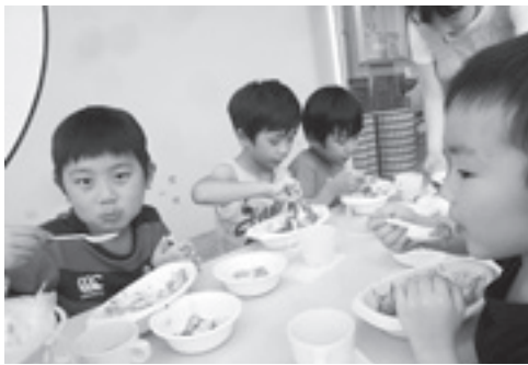
みんなで作ると美味しいね

お泊り会の前は、グループの名前を決めたり、お泊り会で使用する食材を買いに行くなど、グループの友達で話し合いをする場面が多くありました。話し合いや準備を進めていくうちに、子ども達はお泊り会への期待やみんなで話し合いをしながらか決めていく楽しさを感じているようでした。時には自分の意見が通らなかつたり、自分がやってみたかったことができなかつたりすることもありました。ですが、自分で乗り越え気持ちを切り替えていこうとする姿には、子ども達の成長を感じていま